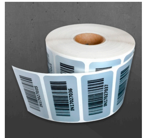
Impresión digital y corte a silueta